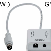
付属コントロール・ボックス GY-1(W) X (S) 共通